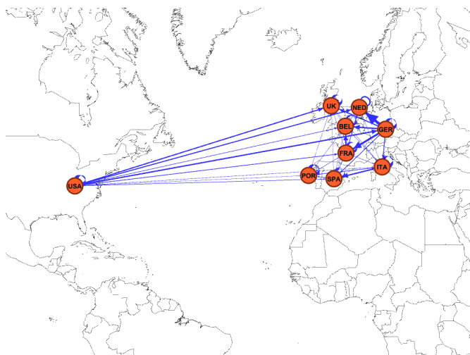
Figura 1: Network e Interconnessioni.

Con l'ausilio grafico del network[6], rappresentato nella Figura 1, possiamo meglio commentare i valori della Tabella 1. Germania e USA si presentano come i maggiori contributori alla volatilità del sistema; molto forte in particolare è l'influenza della Germania sui paesi dell'area centro-europea (Olanda, Belgio, Francia). Il ruolo degli USA rimane comunque prevalente se si osserva che la Germania condiziona il mercato americano per lo 0.30%, mentre gli USA influenzano la Germania per un valore pari al 22.69%.